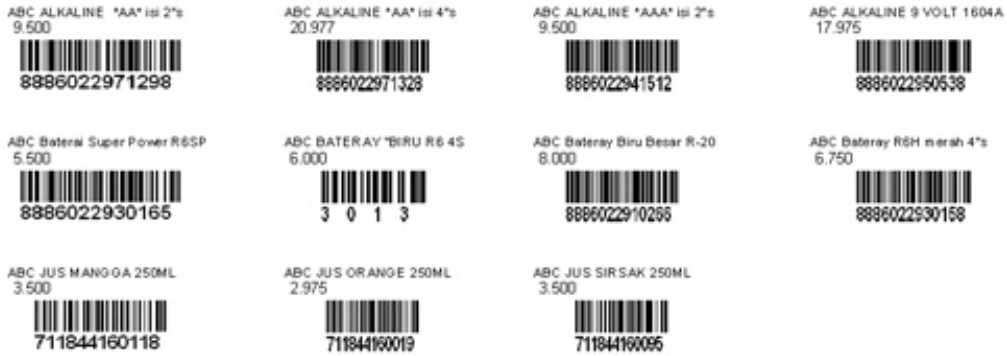
Cetak Label Barcode